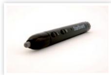
Puntero electrónico (opcional)